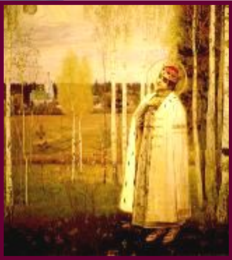
М.Нестеров. Убиенный царевич Дмитрий.

В 1591 г. в Угличе погиб младший сын Ивана Грозного 12-летний царевич Дмитрий. По стране пошли слухи, что его убили по приказу Годунова. Тот назначил комиссию во главе с В. Шуйским и она установила, что смерть-результат несчастного случая. В 1598 г. скончался Федор Иоанович и династия Рюриковичей пресеклась. Для выборов нового царя собрался Земский Собор.