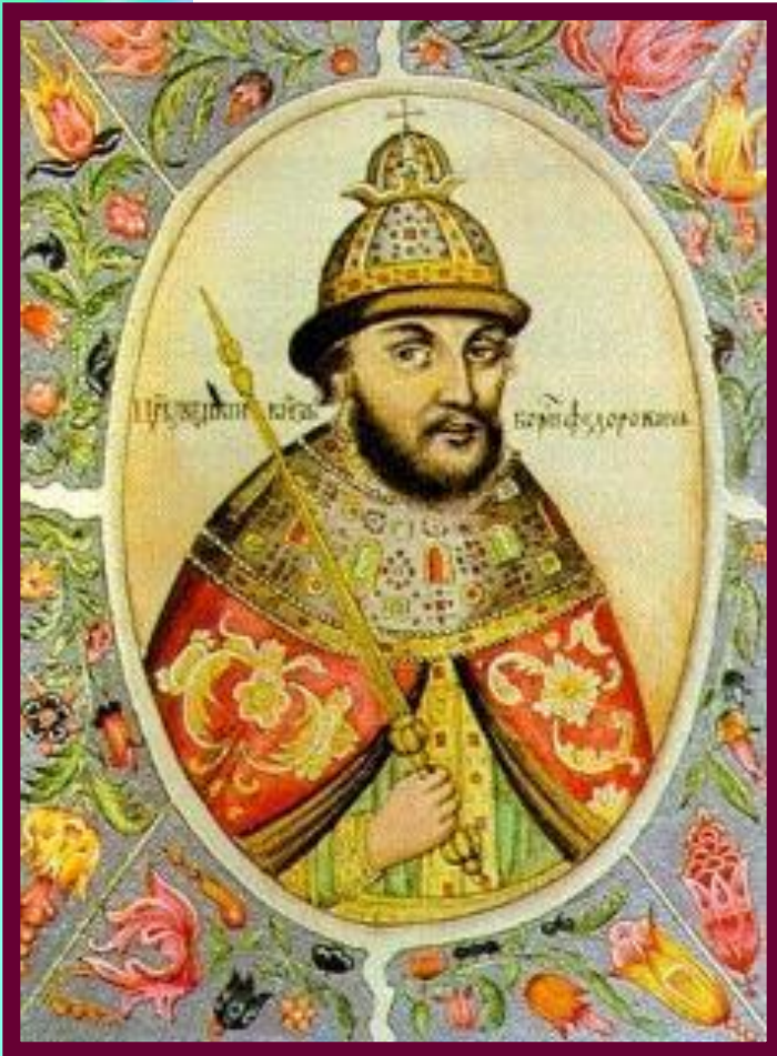
Борис Годунов. Мниатюра из «Титулярника».

Борис Годунов увеличил число «тяглых» людей в городах и в итоге размер тягла снизился.