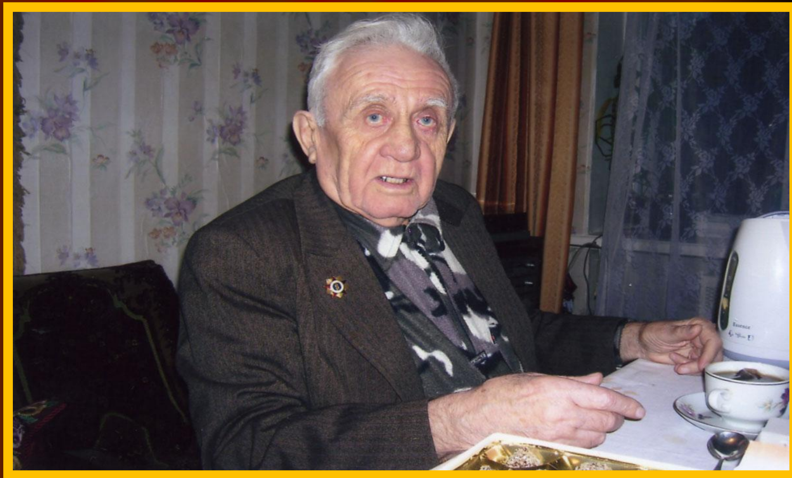
СЕМЕН МОИСЕЕВИЧ РУДИН