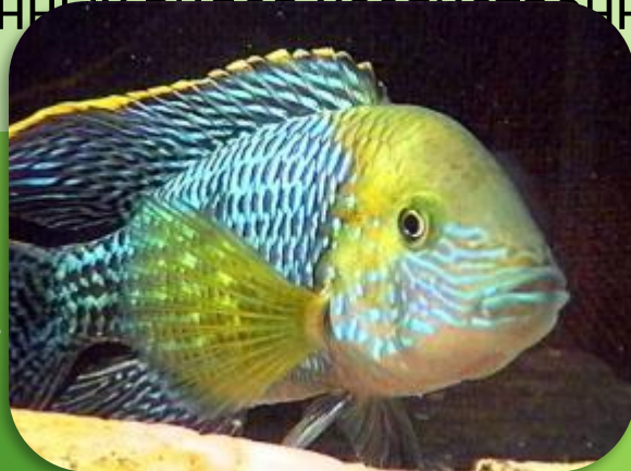
АКАРА БИРЮЗОВАЯ (достигает 50 см)

Озера и реки богаты рыбой. Рыболовство – один из распространенных видов хозяйственной деятельности.