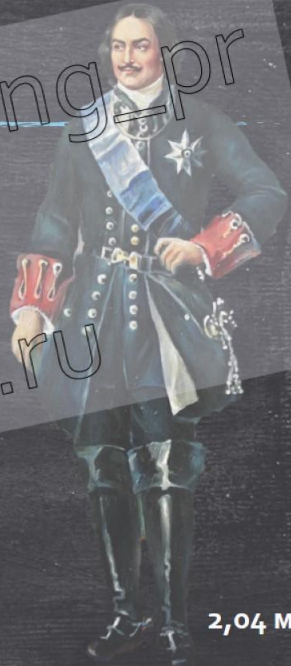
Луи де Рувруа Сен-Симон

«Он был очень высок ростом, хорошо сложен, довольно худощав, с кругловатым лицом, высоким лбом, прекрасными бровями; нос у него довольно короток, но не слишком, и к концу несколько толст; губы довольно крупные, цвет лица красноватый и смуглый, прекрасные чёрные глаза, большие, живые, пронизательные, красивой формы ... когда он наблюдает за собой и сдерживается, в противном случае суровый и дикий, с судорогами на лице, которые повторяются не часто, но искажают и глаза и всё лицо, пугая всех присутствующих... Вся наружность его выказывала ум, размышление и величие и не лишена была прелести» (в 1717 г)