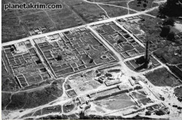
Регулярная, или прямоугольная