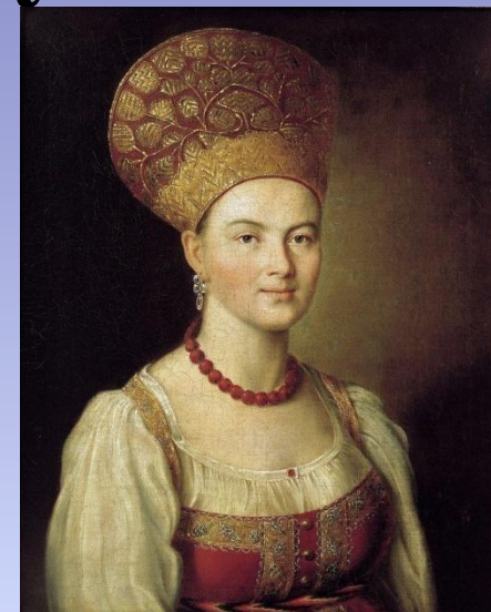
Обладать духовной силой