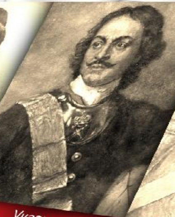
Указы Петра I XVIII в