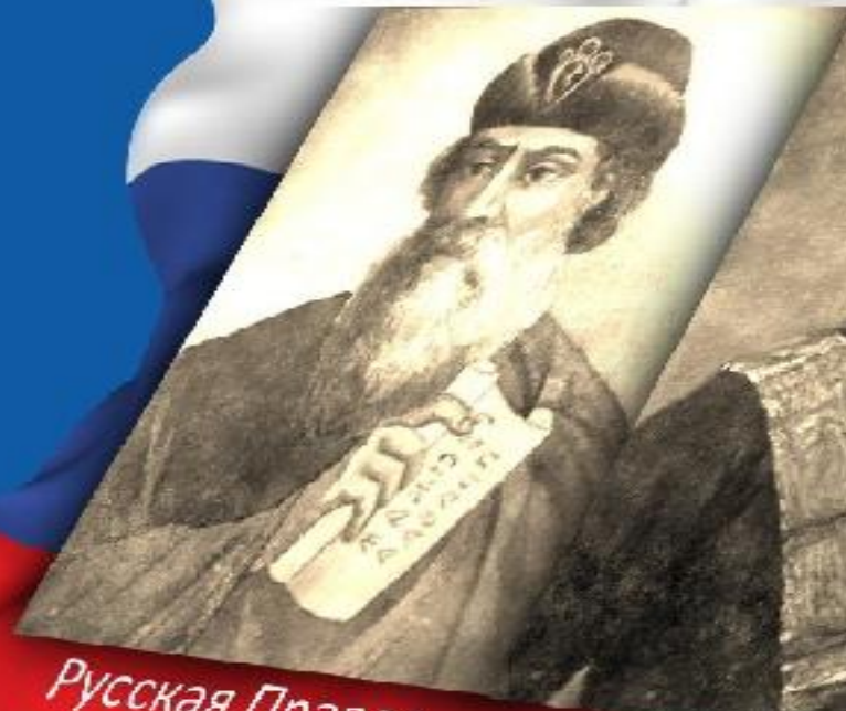
Русская Правда XI в