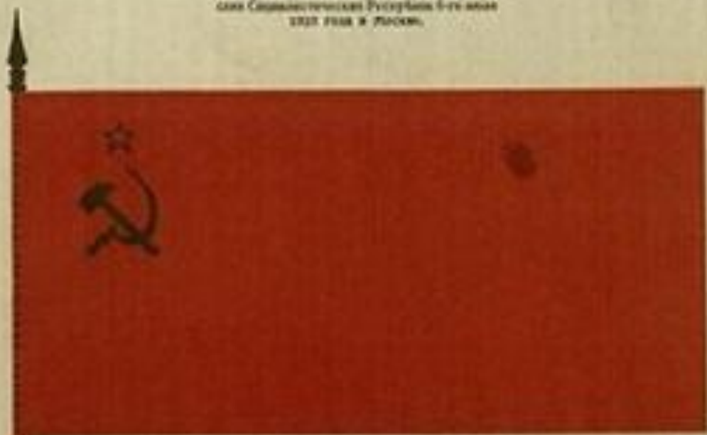
ГОСУДАРСТВЕННЫЙ ФЛАГ СОЮЗА СОВЕТСКИХ СОЦИАЛИСТИЧЕСКИХ РЕСПУБЛИК, утвержденный 2-ой сессией ЦИК Союза 1-го апреля 1926 года в Москве.