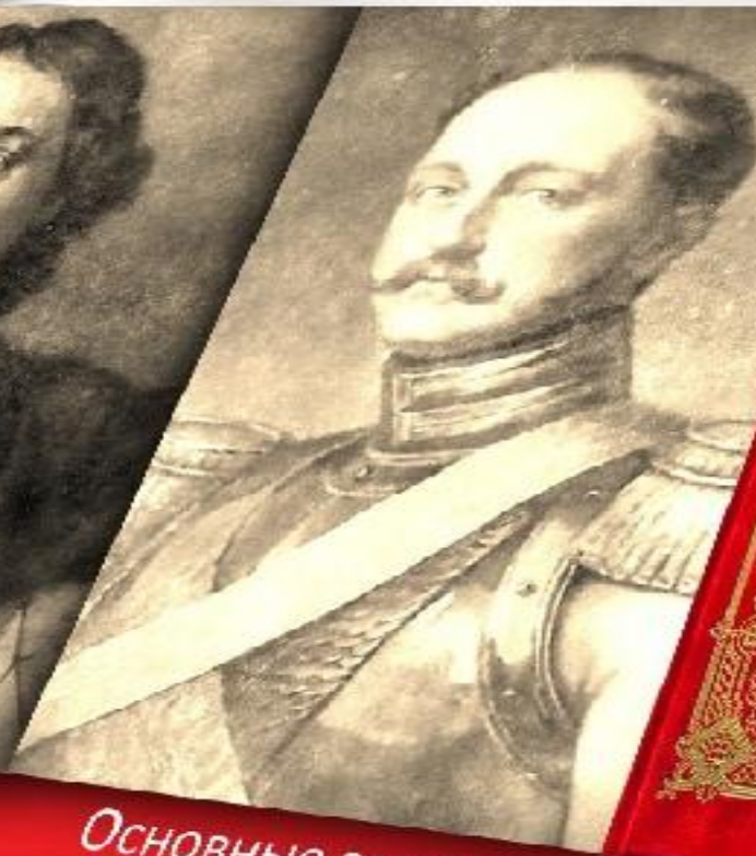
Основные законы Российской Империи XIX в (Николай I)