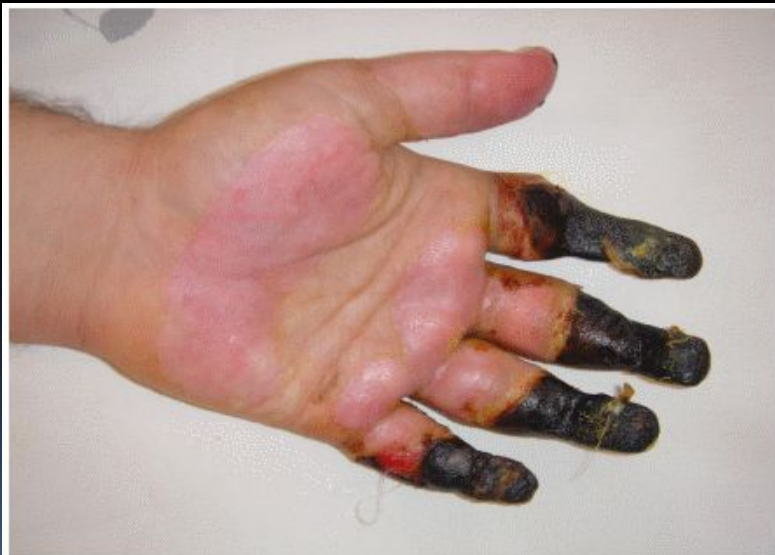
Рис. 5. Четвертая степень отморожения