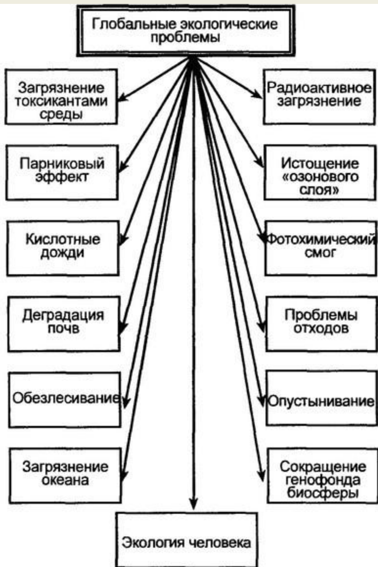
Глобальные экологические проблемы биосферы

Научно-технический прогресс поставил перед человечеством ряд новых, весьма сложных проблем, с которыми оно до этого не сталкивалось вовсе, или проблемы не были столь масштабными. Среди них особое место занимают отношения между человеком и окружающей средой. В XX столетии на природу легла нагрузка, вызванная 4-кратным ростом численности населения и 18-кратным увеличением объема мирового производства. Ученые утверждают, что примерно с 1960-70-х гг. изменения окружающей среды под воздействием антропогенных факторов стали всемирными, т.е. затрагивающими все без исключения страны мира, поэтому их стали называть глобальными .