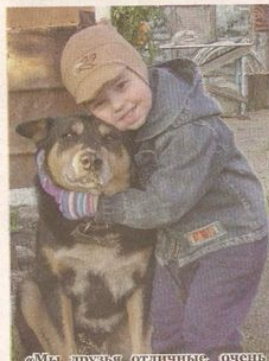
«Мы друзья отличные, очень фотогеничные. Улыбайся и сме- три – нас фотографируют.»