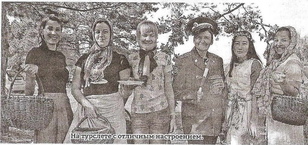
На турслете с отличным настроением.

Четвертый этап заключался в проверке знаний лекарственных трав и их свойств, определение азимута на