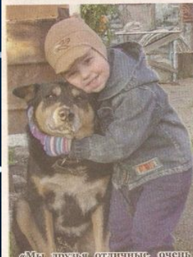
«Мы друзья отличные, очень фотогеничные. Улыбайся и сме- три – нас фотографируют.»