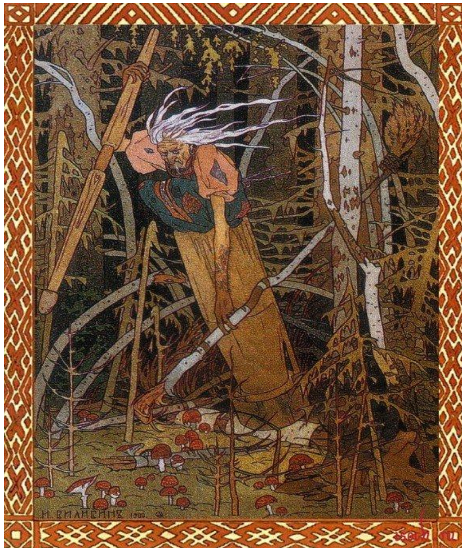
Иван Билибин «Баба Яга»