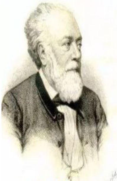
Б.Ауэрбах (1812-1882), немецкий писатель

«Нажить много денег- храбрость; сохранить их – мудрость, а умело расходовать их – искусство»