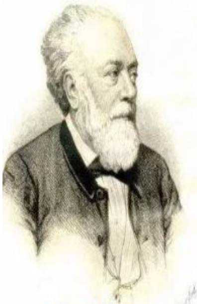
Б.Ауэрбах (1812-1882), немецкий писатель

«Нажить много денег- храбрость; сохранить их – мудрость, а умело расходовать их – искусство»