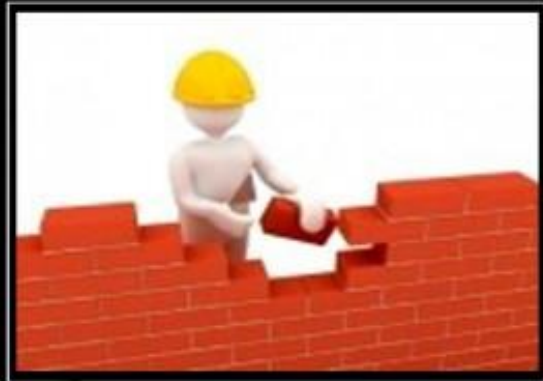
Настройка Брандмауэра Установка обновлений