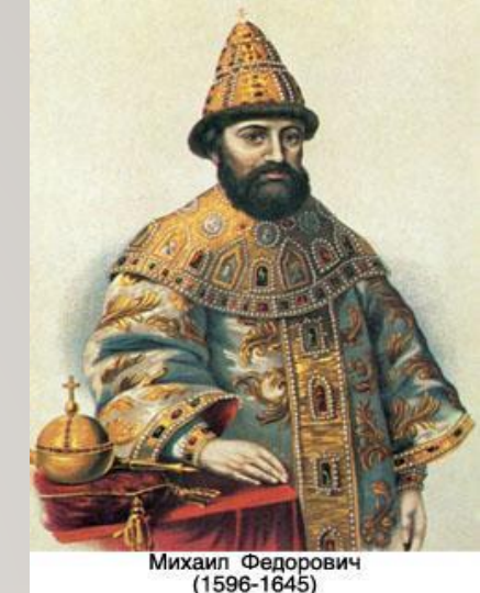
Михаил Федорович (1596-1645)

государственное автономное профессиональное общеобразовательное учреждение Свердловской области «Каменск-Уральский многопрофильный техникум».