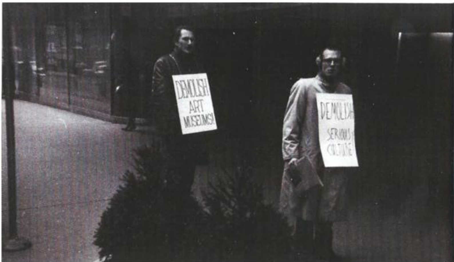
Генри Флинт и Джек Смит возле музея современного искусства в Нью-Йорке, 1963. "Разрушь художественные музеи!", "Уничтожь серьезную культуру!" Перед фасадом МоМА в Нью-Йорке Генри Флинт и Джек Смит демонстрируют плакаты, используя традиционные формы политического протеста.