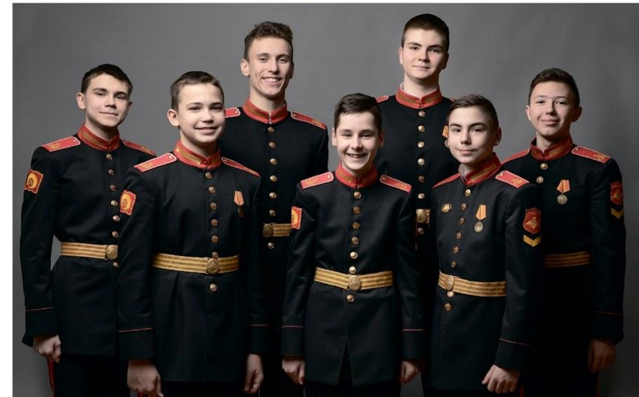
Кадеты Тверского суворовского военного училища Министерства обороны Российской Федерации