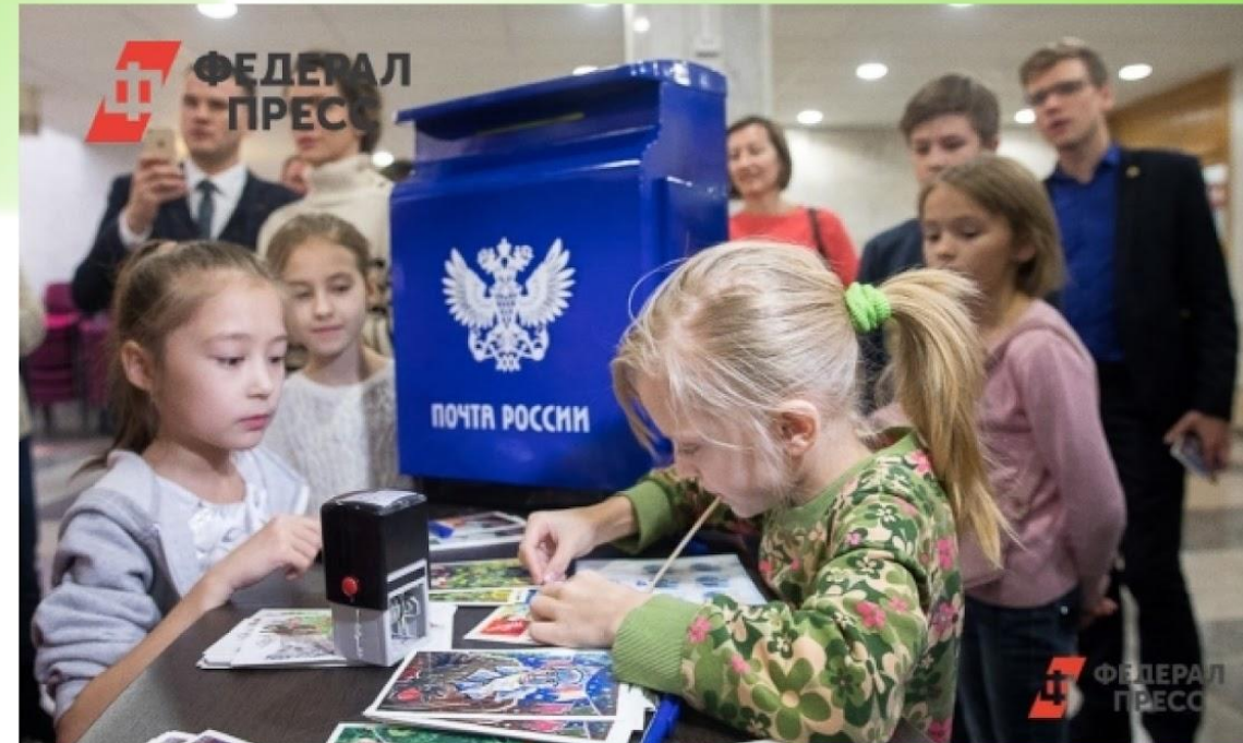
Дети из многодетных семей пишут письма с рисунками для солдат. МОСКВА, 5 марта 2022г.