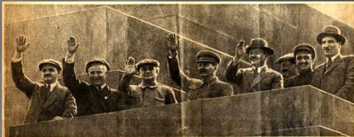
Товарищи Шверник, Хрущев, Димитров, Сталин, Молотов, Булганин, Микоян и Чубарь на трибуне маюлся 12 сентября.