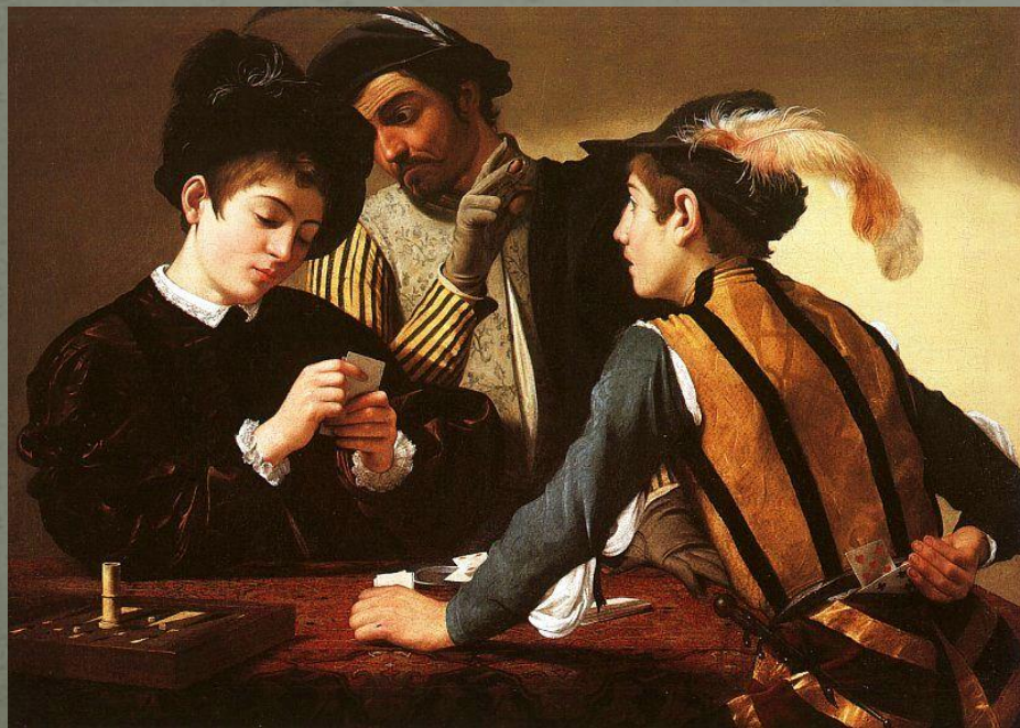
Караваджо «Шулеры» 1596