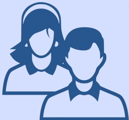
Агент по ВиПП