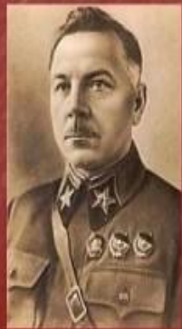
Климент Ефремович Ворошилов

Осуществляла общее руководство фронтами.