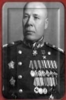
Семён Константинович Тимошенко

(потом была преобразована в СТАВКУ ВЕРХОВНОГО КОМАНДОВАНИЯ)