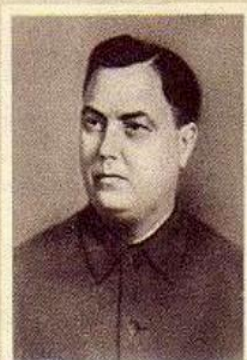
Г. М. МАЛЕНКОВ