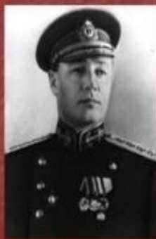
Николай Герасимович Кузнецов