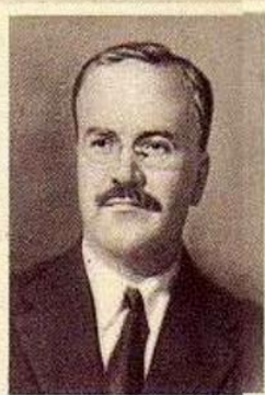
В. М. МОЛОТОВ