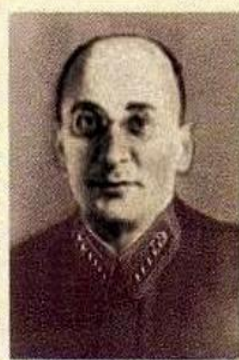
Л. П. БЕРИЯ

30 июня 1941 года – создан Государственный Комитет Обораны (ГКО)