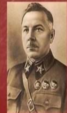
Климент Ефремович Ворошилов

Осуществляла общее руководство фронтами.