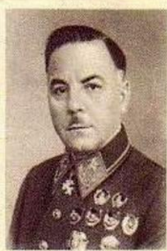
К. Е. ВОРОШИЛОВ