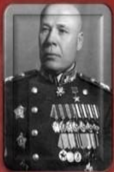
Семён Константинович Тимошенко

(потом была преобразована в СТАВКУ ВЕРХОВНОГО КОМАНДОВАНИЯ)