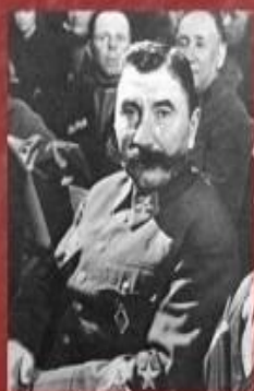
Семён Михайлович Будённый

Осуществляла общее руководство фронтами.