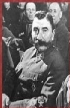
Семён Михайлович Будённый

Осуществляла общее руководство фронтами.