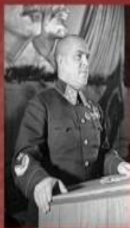
Георгий Константинович Жуков