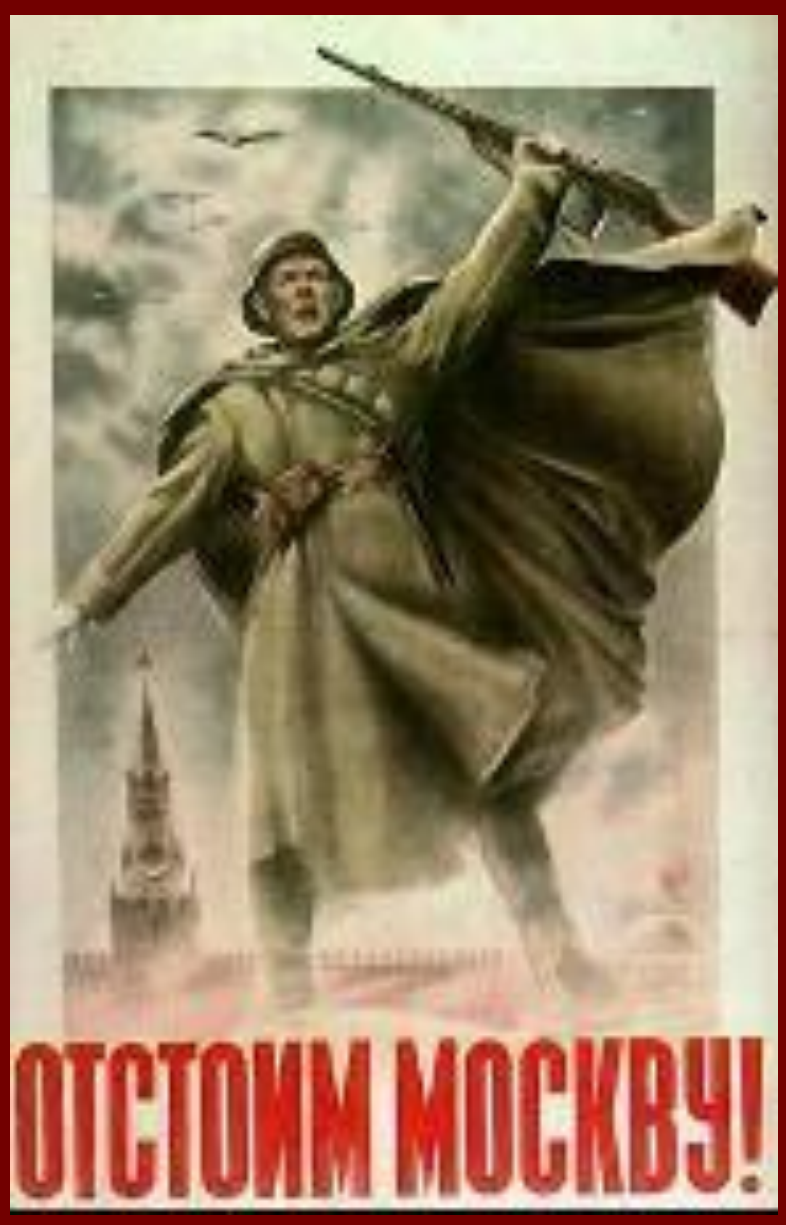
Плакат 1941 г.

Для захвата Москвы был подготовлен план «Тайфун» . Немцы попытались достичь на этом направлении троекратного превосходства в живой силе и технике. 30 сентября началось генеральное наступление.