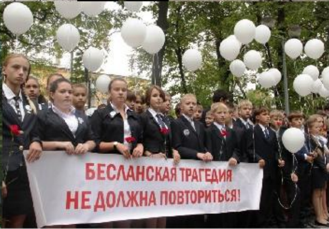
БЕСЛАН, СЕНТЯБРЬ 2004