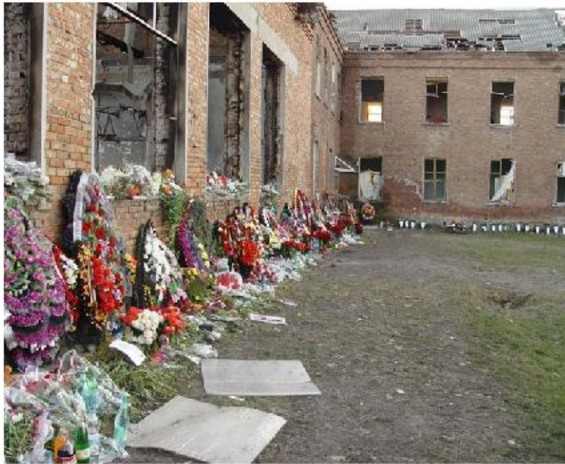
Здание школы после теракта