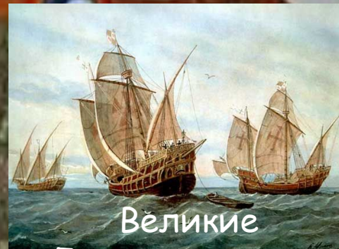
Великие Географические открытия