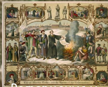
Реформация и абсолютизм