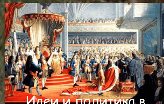
Идеи и политика в Европе в XVIII веке