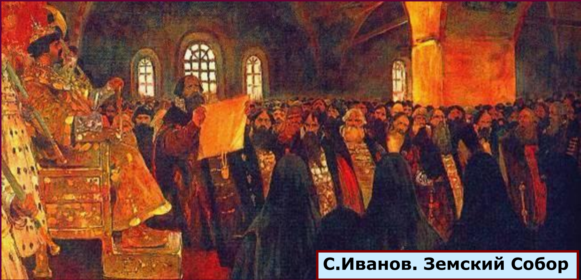
С.Иванов. Земский Собор

Собравшийся в 1648 г. Земский собор принял решение разработать новый свод законов вместо устаревшего "Судебника" XVI в., а также противоречивших друг другу законов и указов периода Смуты и послесмутного времени. Состоявшее из 25 глав Уложение было принято в январе 1649 г. Земским собором и действовало более 200 лет.