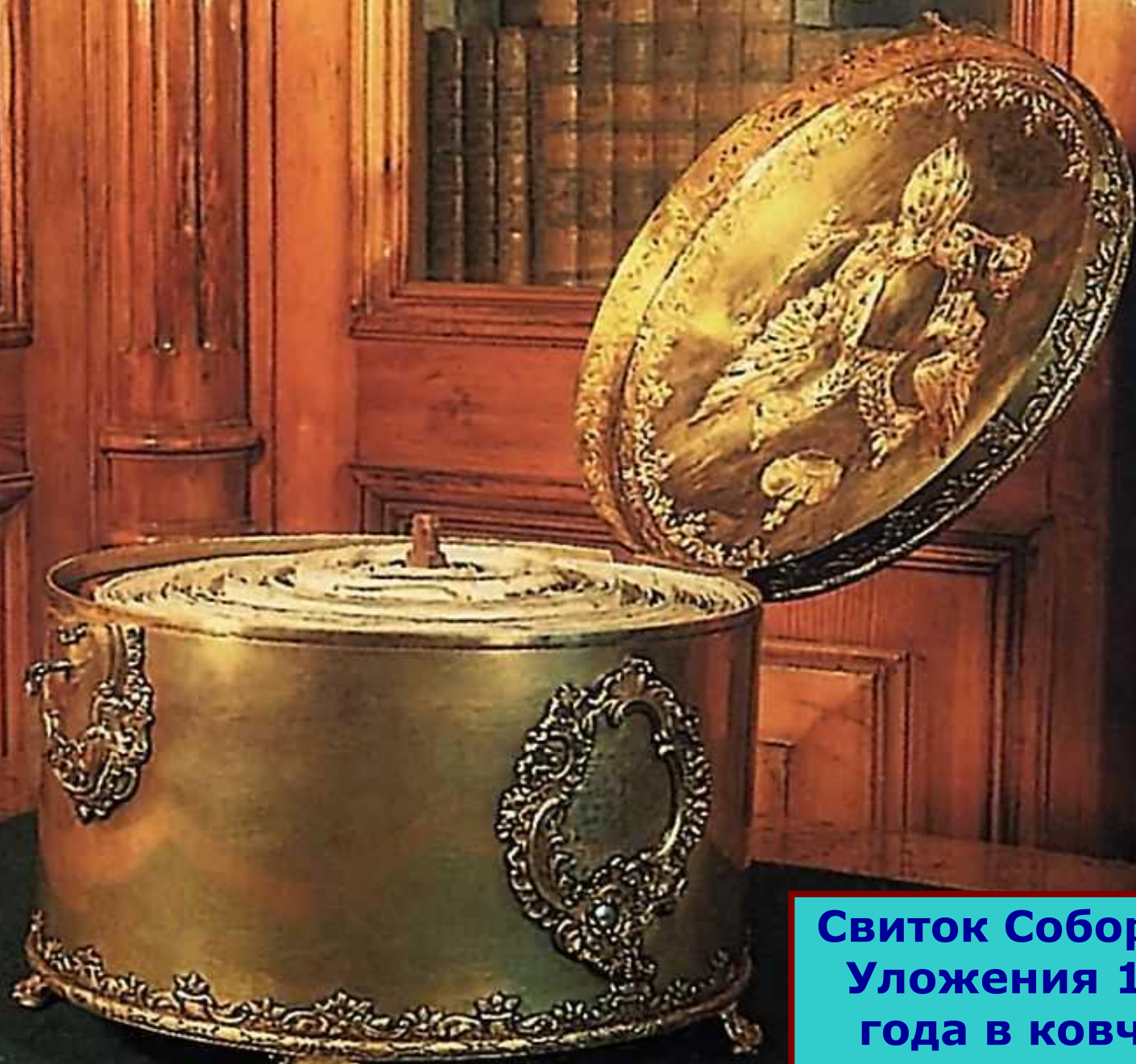
Свиток Соборного Уложения 1649 года в ковчеге