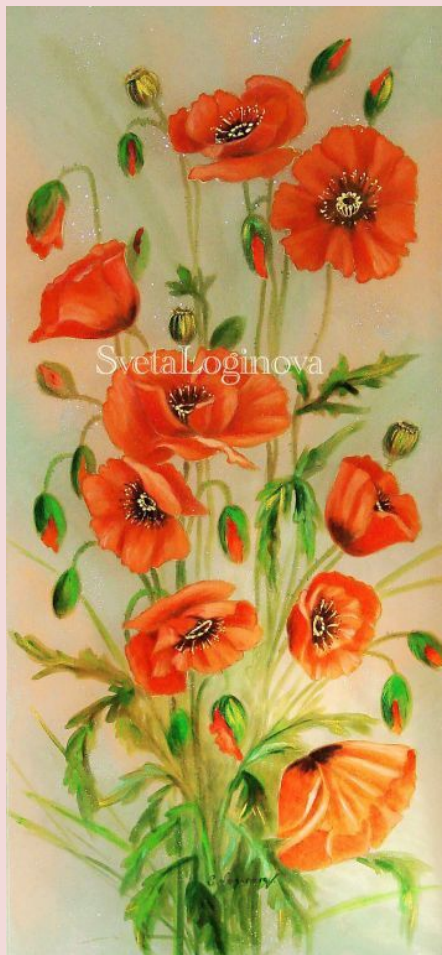
С. Логинова Маки

Родители отказались от мелкой опеки по отношению к сыну.