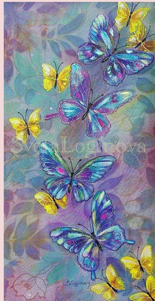
С. Логинова. Влюбленные бабочки