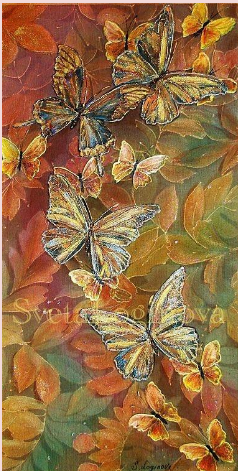
С. Логинова. Влюблённые бабочки.

Проверь себя Вскрытие рек ещё больше повысило уровень воды. На этой-то вечеринке он и начал с ней флиртовать. Писатель играл большую роль в литературе конца века. У него врачи подозревали злокачественную опухоль. У нас в стране очень плохая окружающая среда.