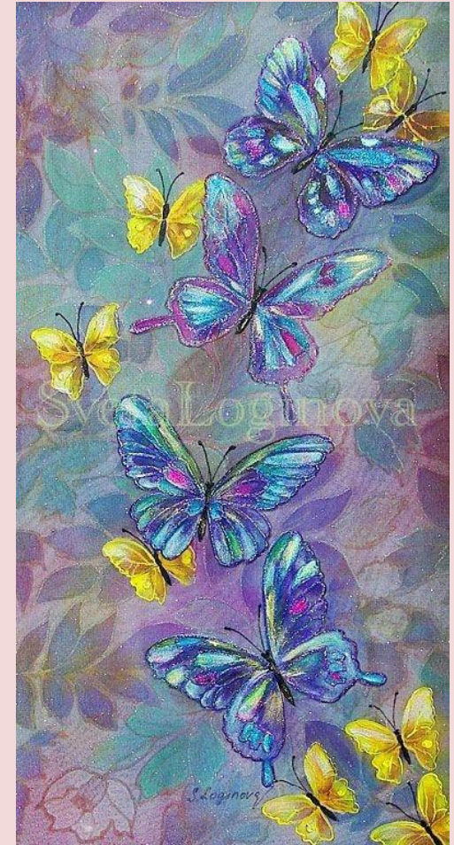
С. Логинова. Влюбленные бабочки