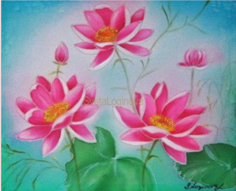
С. Логинова. Хрустальные лотосы

Исправить лексические и стилистические ошибки.