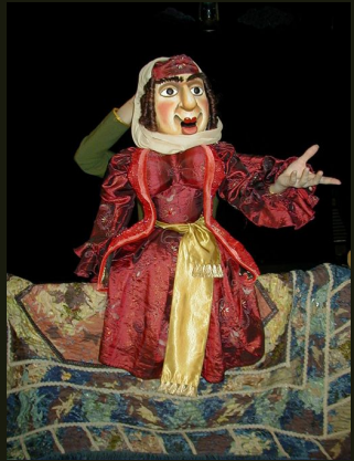
Комедия - водевиль "Ханума"