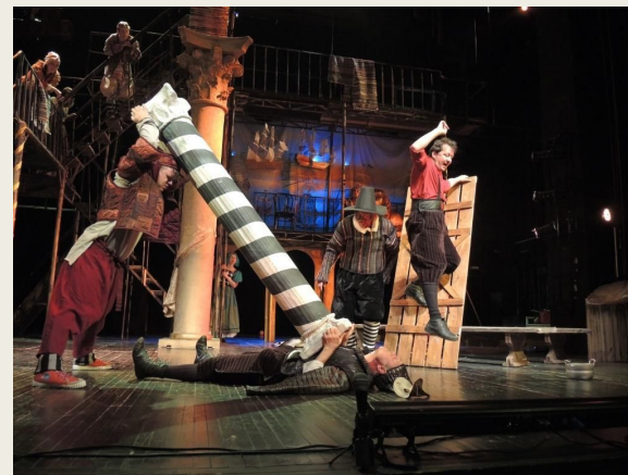
"КОМЕДИЯ ОШИБОК" карнавальные страсти в 2-х действиях