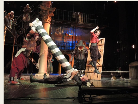
"КОМЕДИЯ ОШИБОК" карнавальные страсти в 2-х действиях