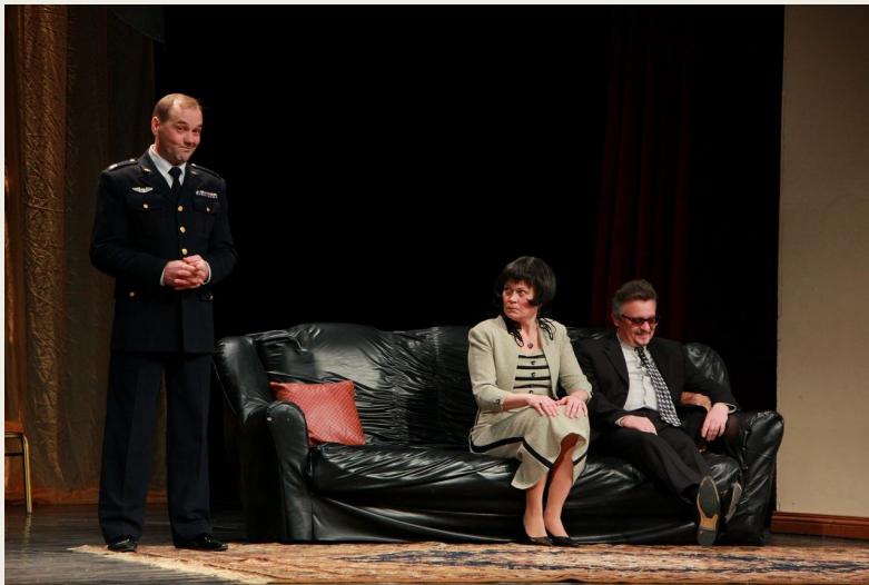
"Мужской род, единственное число"