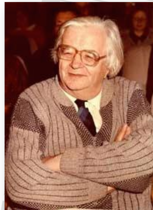
Валентин Дмитриевич Берестов

Родился Валентин Берестов в маленьком, тихом городке 1 апреля , в семье учителя истории. Отец будущего поэта и сам писал в юности стихи, и сыну сумел привить любовь к чтению. Поэтические способности у мальчика обнаружались очень рано. Он записывал стихи в тетрадь и хранил её в тайнике. Было это в 1942 году в Ташкенте, где в эвакуации жила семья Берестовых. В 1944 они перебралась в Подмосковье. В Москве Валентин Дмитриевич поступил на исторический факультет МГУ, затем в аспирантуру института этнографии. В 1946 году его произведения начинают публиковаться в печати. А в 1957 выходят его первый поэтический сборник «Отплытие» и тоненькая книжка для дошкольников «Про машину».