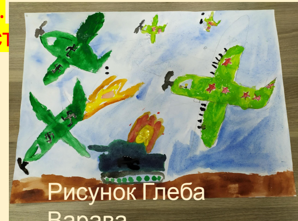
Рисунок Глеба Варара