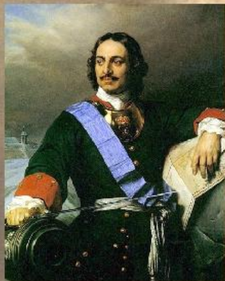
Петр I учредил прокуратуру

С 1996 года 12 января отмечается в России как День работника прокуратуры.