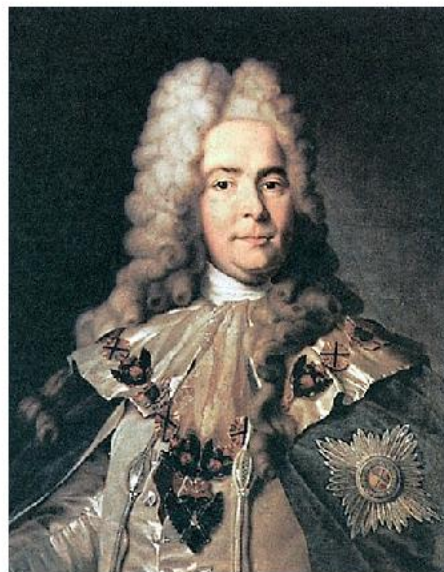
Ягужинский П. И.

Контроль над деятельностью Сената – «око государево»