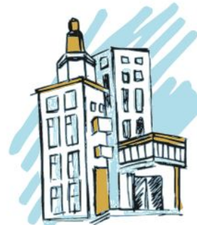
Вход для организаций