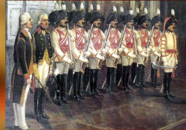
Офицерский смотр армии Павла 1