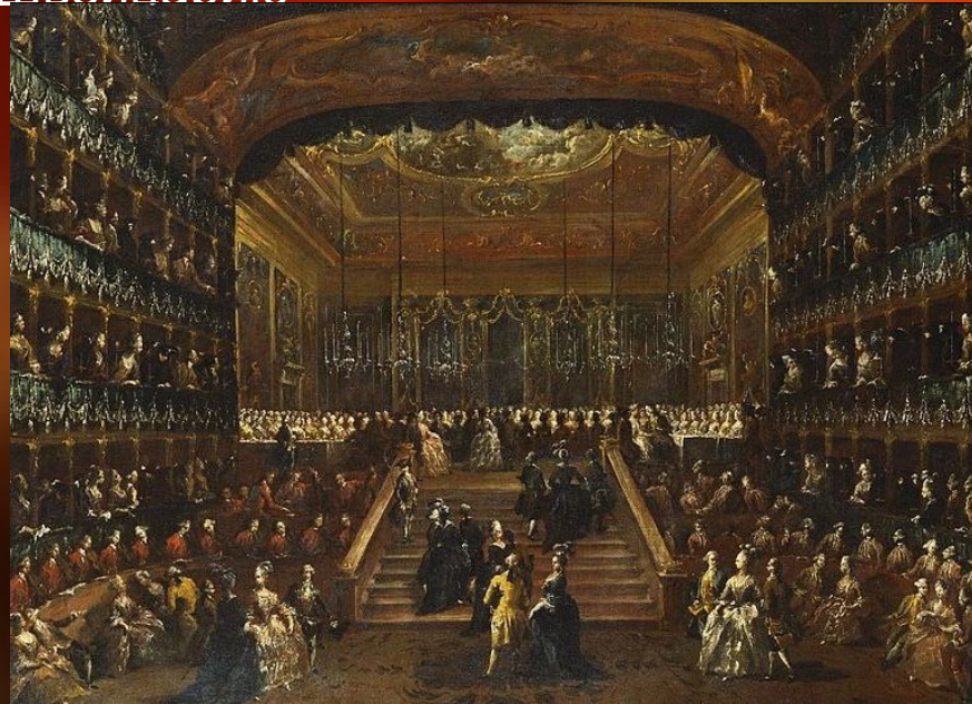
Ужин и бал в честь графа и графини Северных в театре Сан Бенедетто. Фр. Гварди, 1782

В 1781-1782 гг. Павел Петрович совершил вместе с супругой Марией Федоровной большое путешествие по Европе под именем графа Северного. Они посетили Польшу, Австрию, Италию, Францию, Бельгию, Латвию, Швейцарию