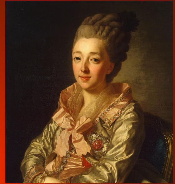
княжна Наталья Алексеевна

В союзе с Марией Федоровной у императора родились 10 детей. Марии суждено было стать матерью сразу двоих правителей, Александра 1 и Николая 1