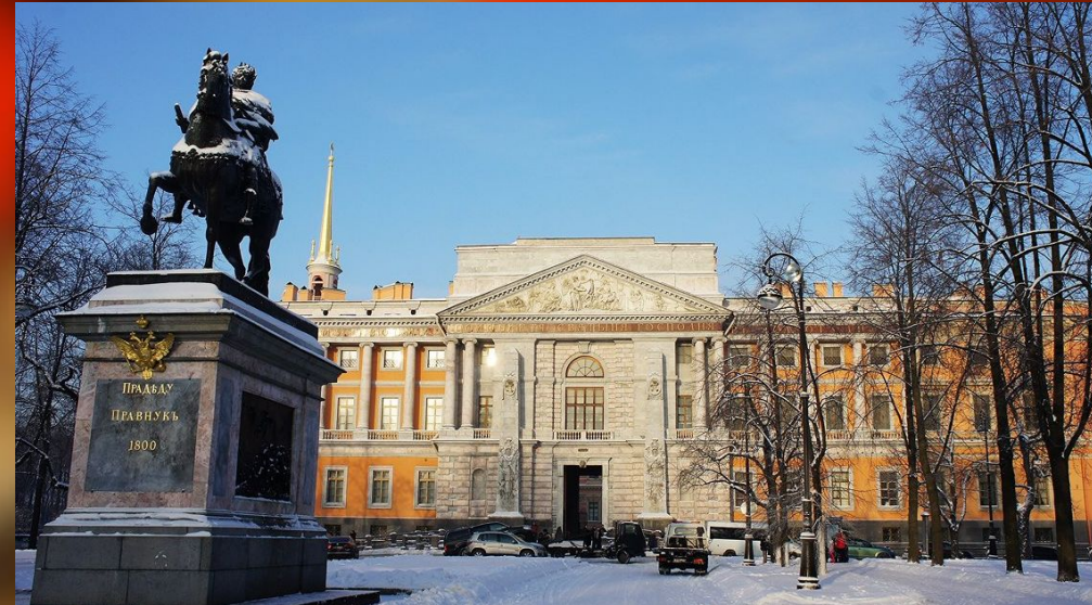
Михайловский замок и памятник Петру Великому

С целью сохранения спокойствия в России и непроникновения идей французской революции были наложены запреты на французскую литературу и периодику, а также на французские товары и даже на моду.