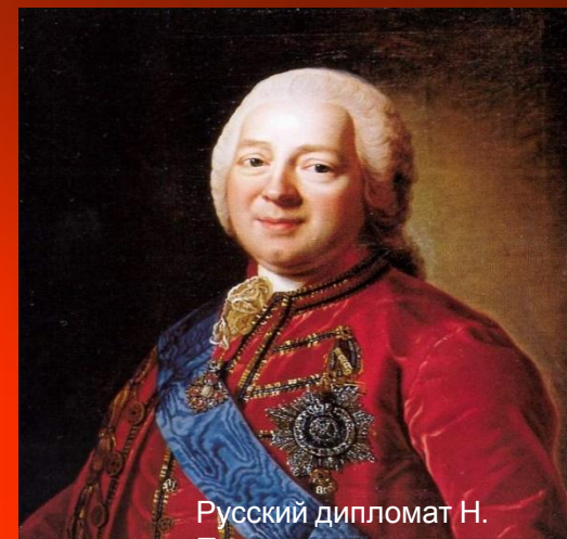
Русский дипломат Н. Панин