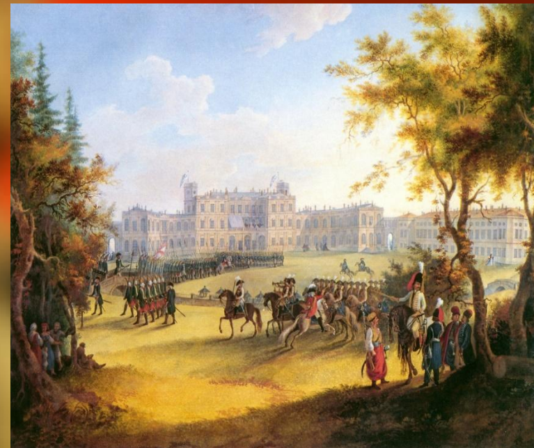
Гатчинская усадьба. Подарок Екатерины

Александр (1777-1825)(1 рис), Константин (1779-1831), Александра (1783-1801), Елена (1784-1803), Мария (1786-1859), Екатерина (1788-1819), Ольга (1792-1795), Анна (1795-1865), Николай (1796-1855), Михаил (1798-1849)(2 рис).