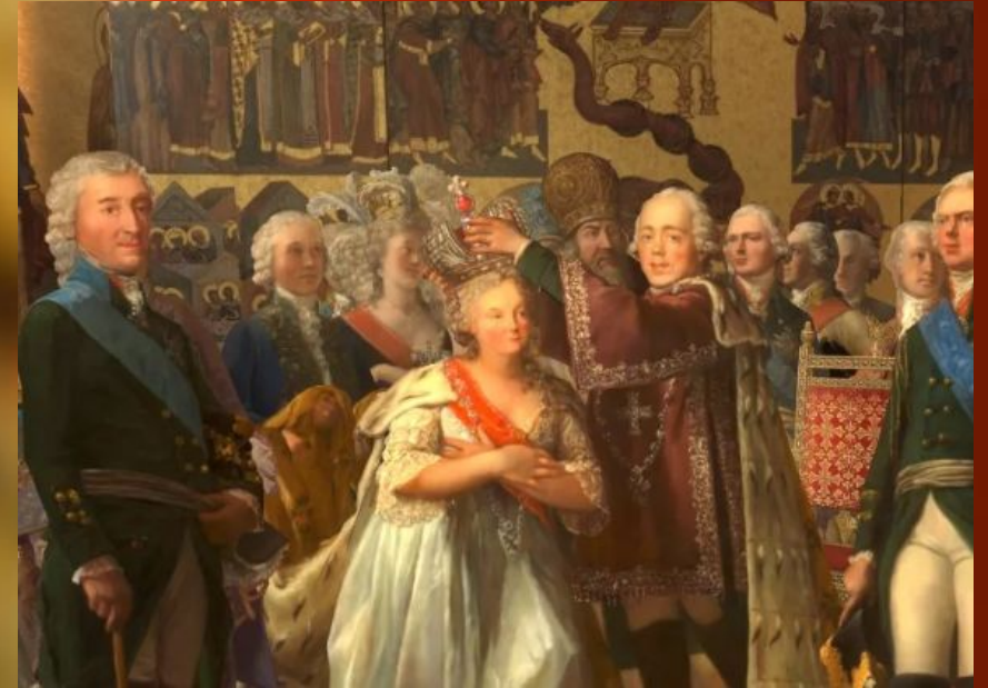
Коронация Павла Петровича. Москва. Пасхальное Воскресение

«Екатерина становилась стара и немощна, она не могла думать без страха о том, что великое государство, столь быстро выдвинутое ею на путь благоденствия и славы, останется без всяких гарантий прочного существования...Екатерина уже сделала многое для конституционного развития своей страны и если бы ей удалось убедить Павла сделаться государем конституционным, то она умерла бы спокойно, не опасаясь за будущее России»