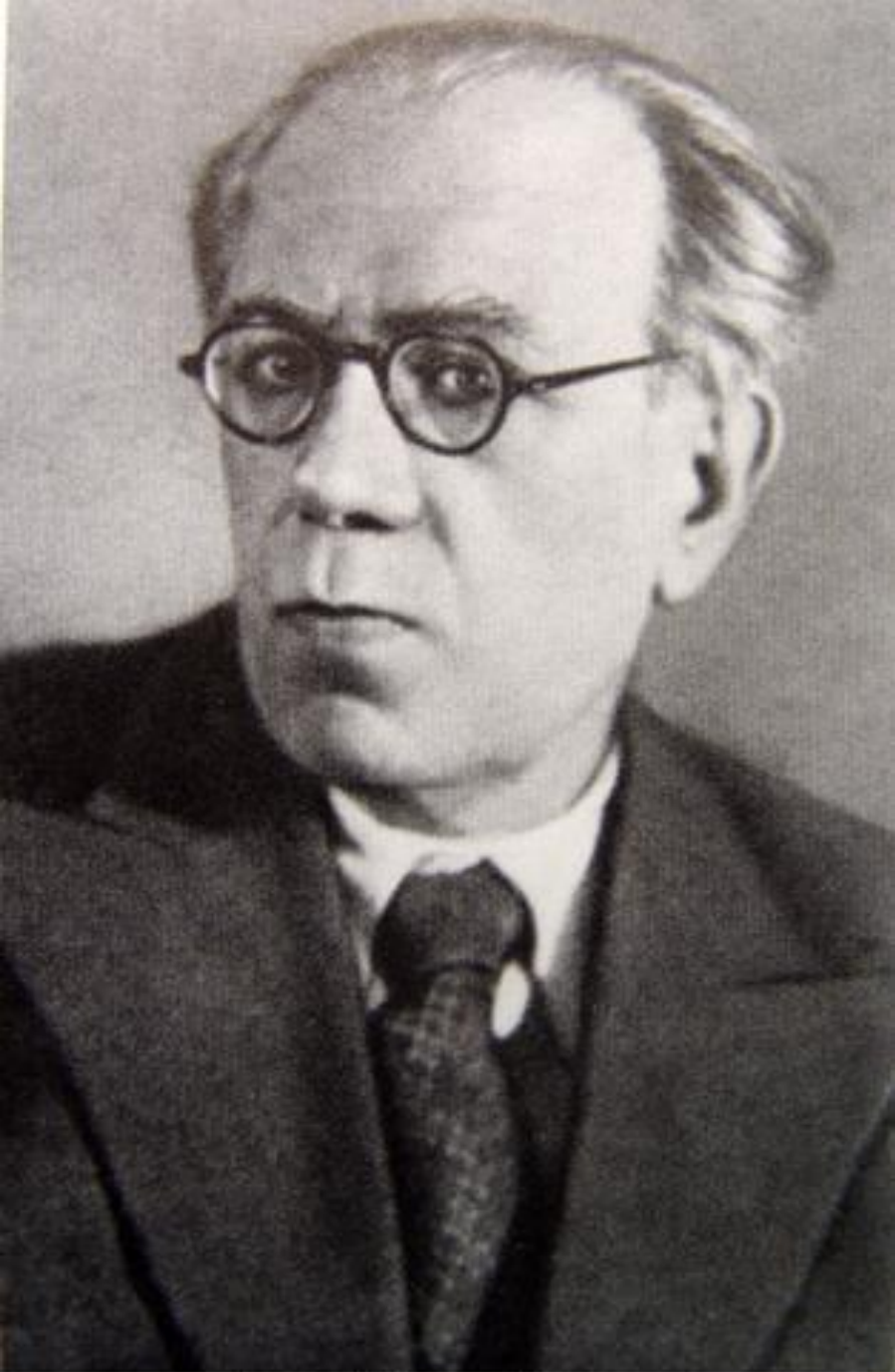
Пичета Владимир Иванович

В. Пичета – первый ректор БГУ, организатор Инбелкульта и Академии наук.