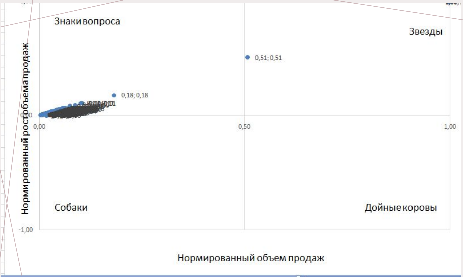
Матрица BCG для первых 300 товаров