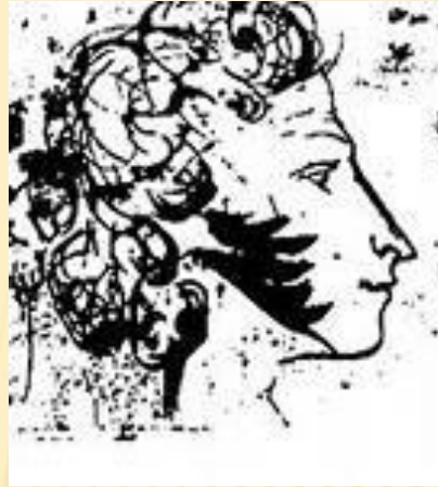
Елизавета Ксаверьевна Воронцова