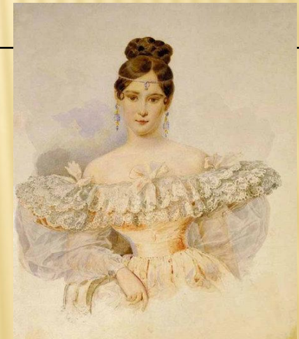
Наталья Николаевна Гончарова