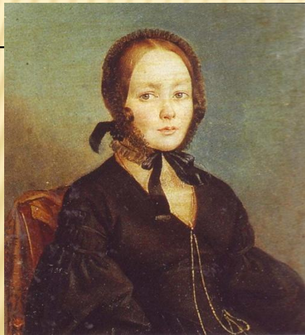
Анна Петровна Керн