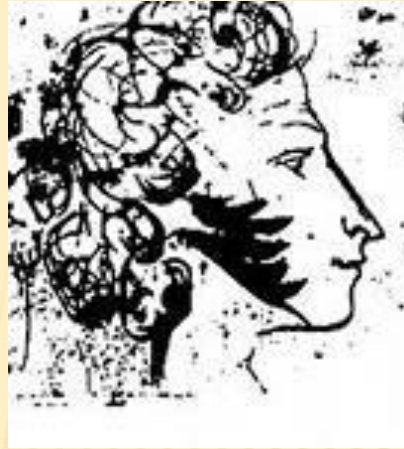
Елизавета Ксавьерьевна Воронцова