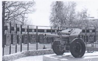
Аллея героев в г. Котовске

также в городе Котовске, на аллее героев и