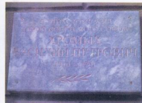
Мемориальная доска на доме Хромых В.П.