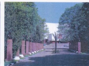
Аллея героев в парке Победы г. Белгорода