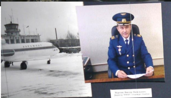
Ветераны работы самолета Як-40 в аэропорту Тамбова, 1979г.