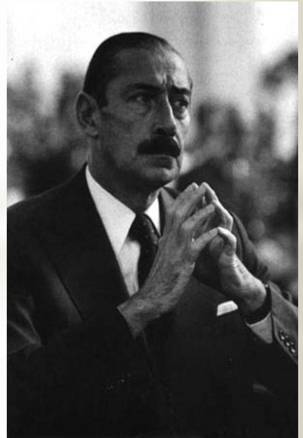
Хóрхе Рафаэль Видéла Редóнд