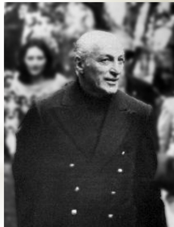
Хосе Лопес Рега