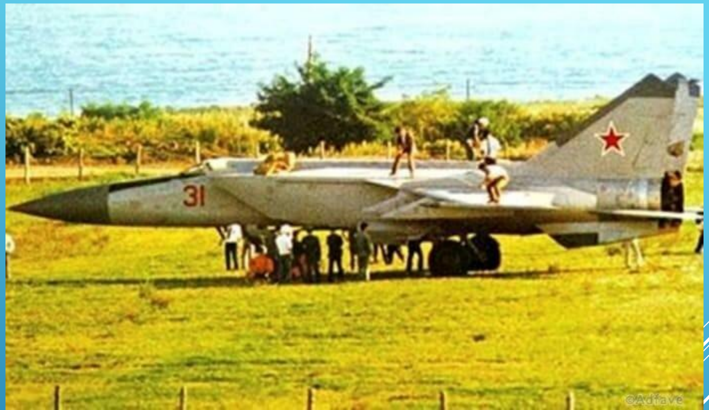
Истребитель в японском аэропорту