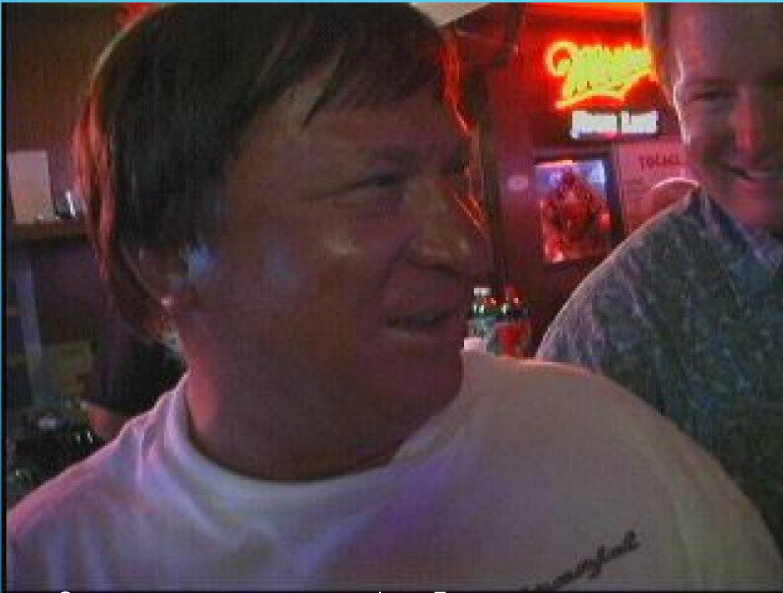
Относительно современное фото Беленко в американском баре