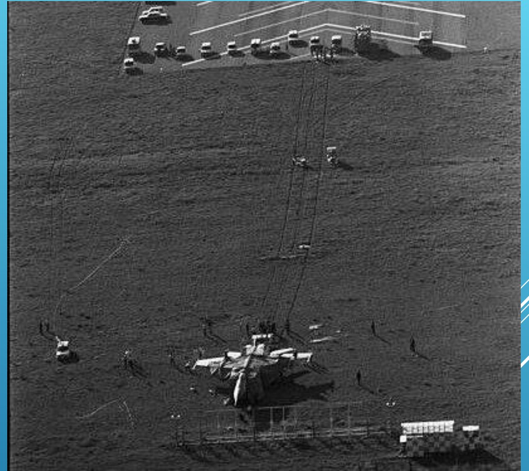
Самолет Беленко при посадке выкатился за пределы ВПП и чуть не задел светосигнальную систему