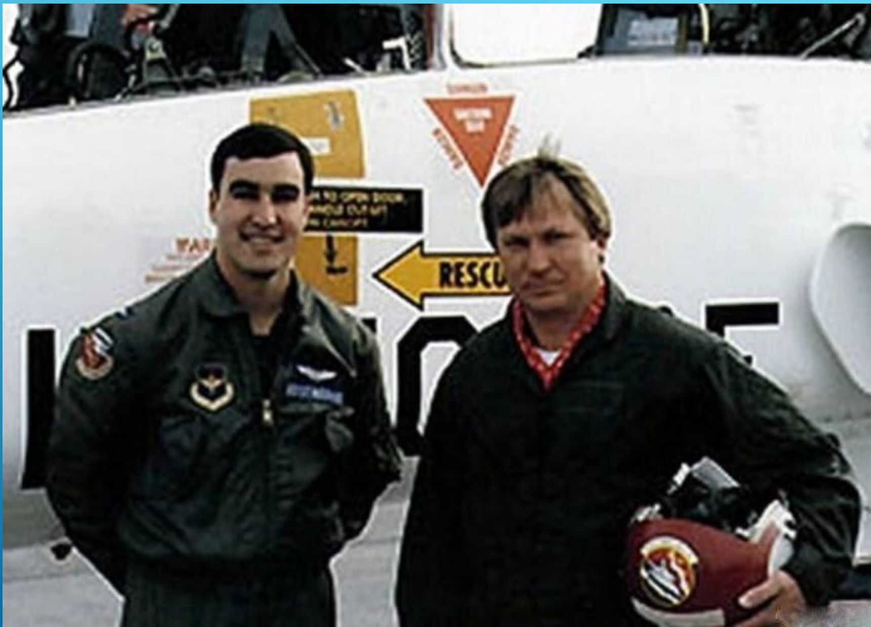
Беленко с новыми американскими "друзьями"