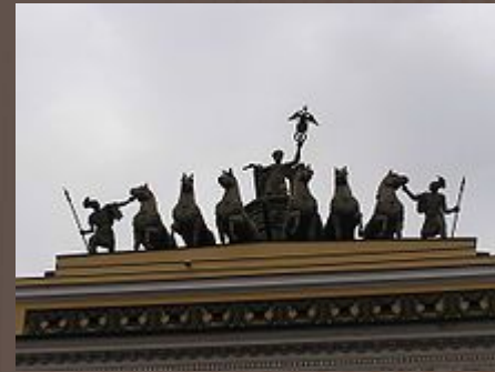
Колесница Победы на арке Главного штаба