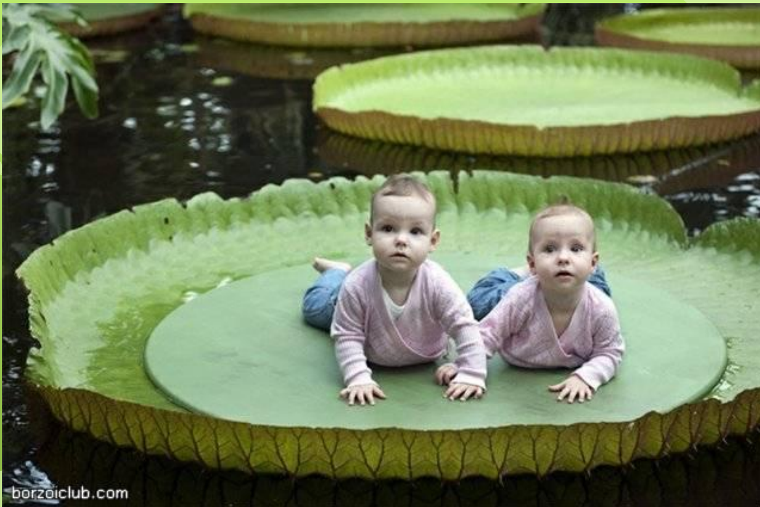
Виктория Амазонская - гигантская кувшинка.