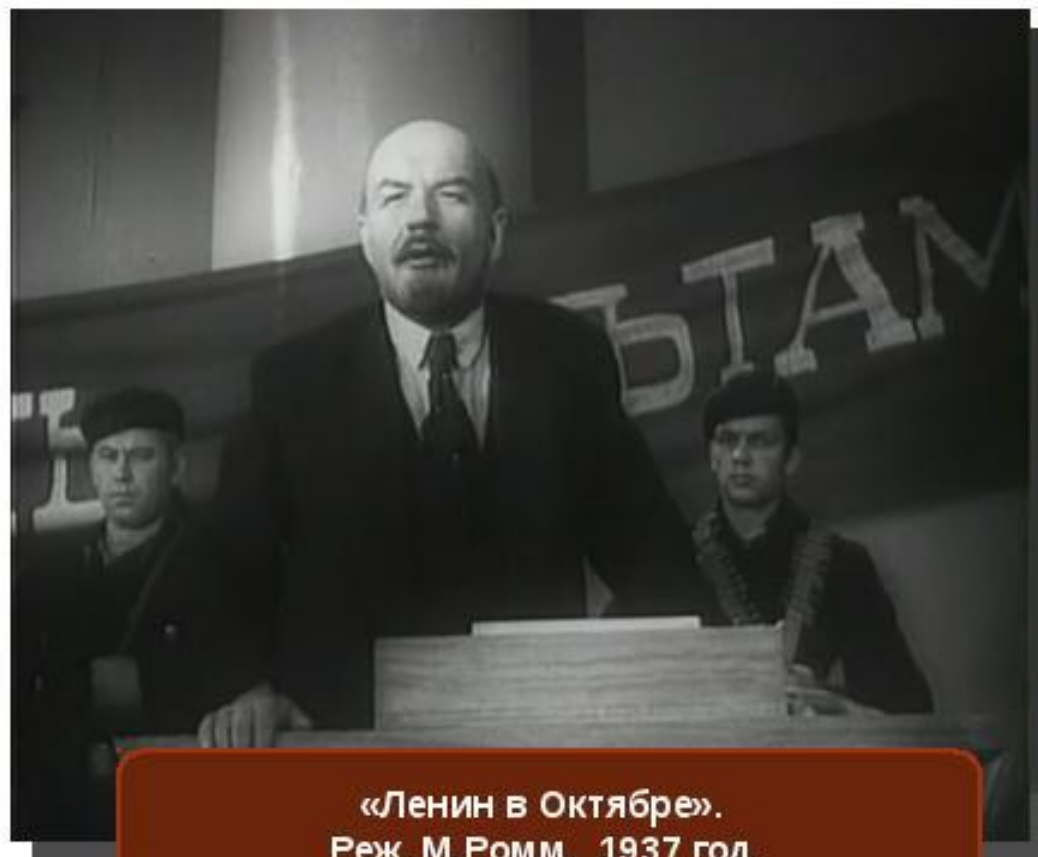
«Ленин в Октябре». Реж. М.Ромм. 1937 год.