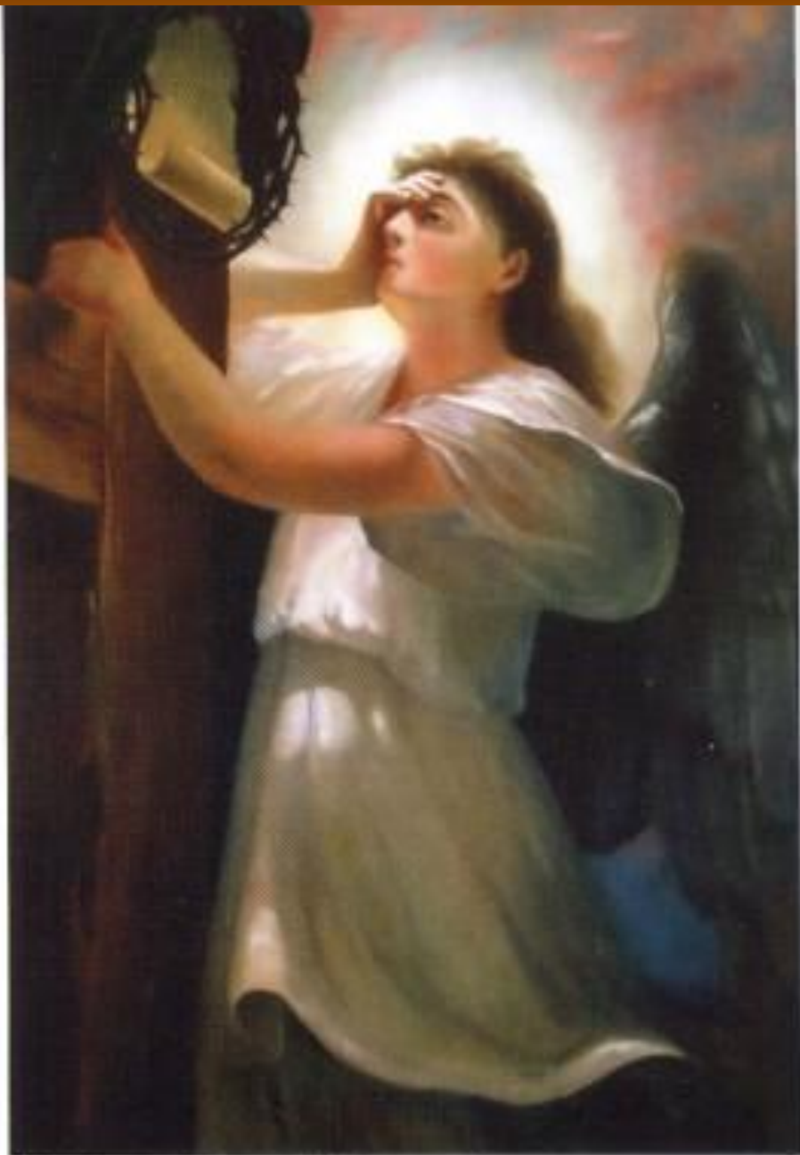
Скорбящий Ангел. К. Хетагуров