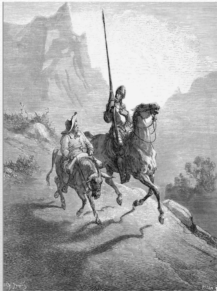
Иллюстрация к роману «Дон Кихот»

В литературе Возрождения наиболее полно выразилось прославление гармоничной, свободной, творческой, всесторонне развитой личности. Литература Возрождения опиралась на две традиции: народную поэзию и античную литературу, поэтому часто реальные события сочетались с фантастикой. Это нашло отражение в наиболее известном литературном произведении эпохи – романе Мигеля Сервантеса «Дон Кихот».