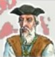
Васко да Гама