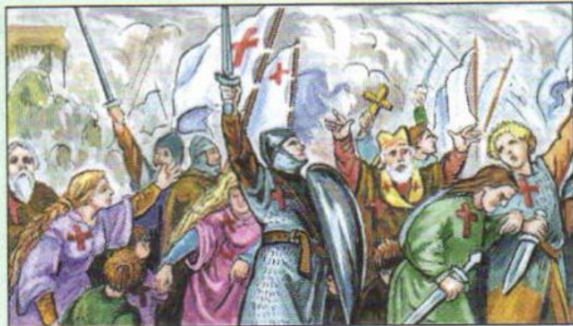
Европейцы откликаются на призыв Урбана II

Первыми в Крестовый поход двинулись тысячи разорённых крестьян и горожан. Их толпы прошли всю Европу, каждый город принимая за Иерусалим, разоряя его и убивая жителей. Наконец они переправились в Азию, где были изрублены турками.