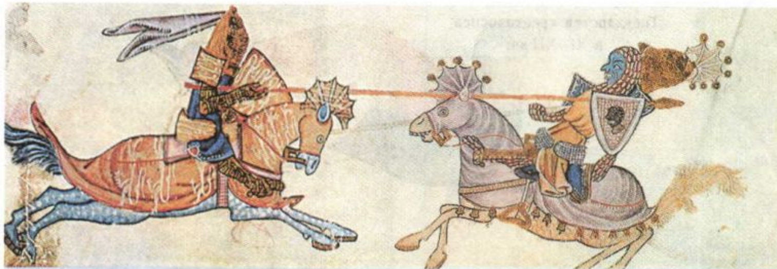
Поединок христианского рыцаря с сарацинским воином. Миниатюра

Господство крестоносцев на Востоке не могло быть прочным. Во-первых, вместе с феодальными отношениями сюда неизбежно переносились феодальная раздробленность и усобицы. Во-вторых, удобных для обработки земель здесь было немного, следовательно, число феодалов и рыцарей, готовых за них сражаться, тоже было ограничено. В-третьих, покорённые местные жители оставались мусульманами и подвергались жесточайшему угнетению. Пока сарацины — так называли мусульман в Европе — воевали с христианами порознь, те ещё могли сопротивляться, но стоило мусульманам объединиться — и силы становились неравными.