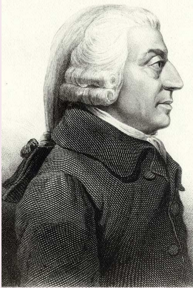
Адам Смит (1723-1790 гг.)