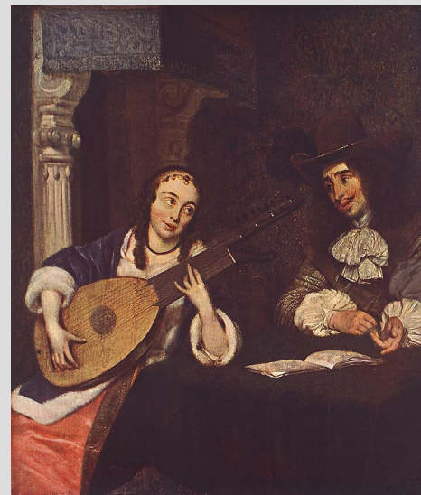
Герард Терборх. Женщина играет на лютне.