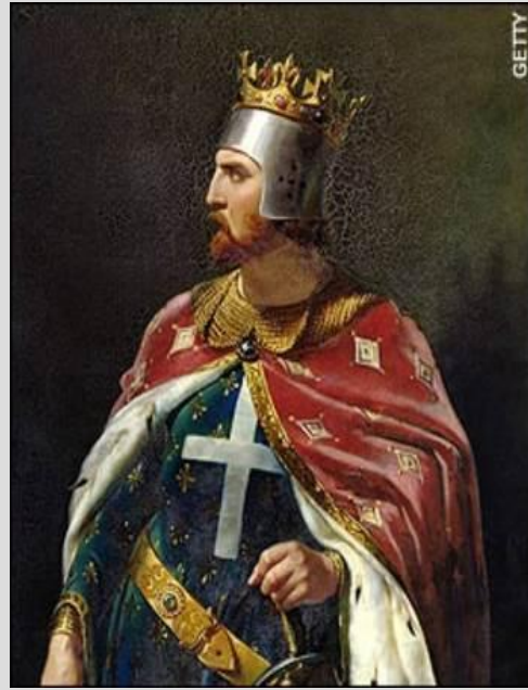
Рис. 7. Ричард Львиное Сердце – король Англии