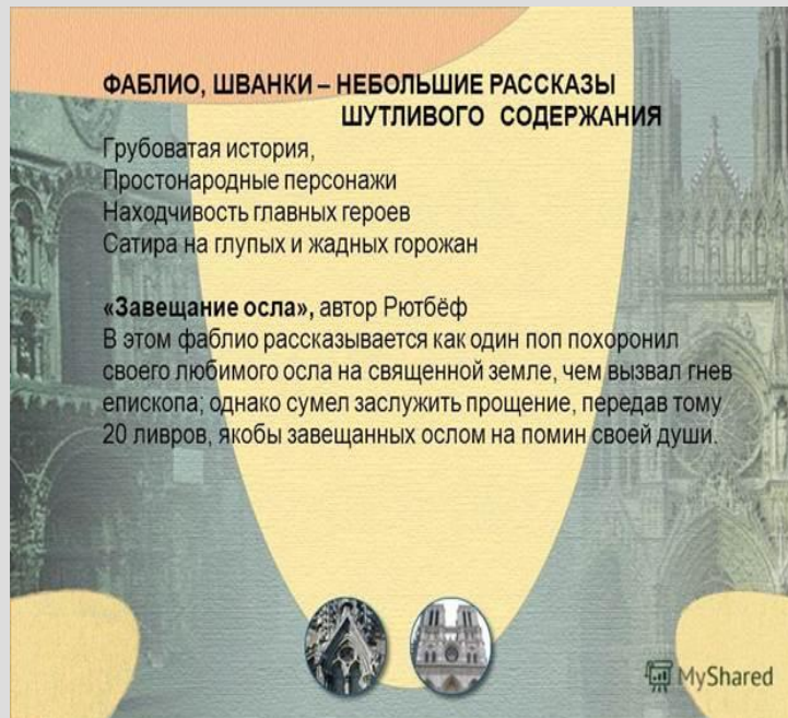
Рис. 5. Фаблио и шванки

Культура горожан представлена в виде фаблио и шванков (Рис. 5).