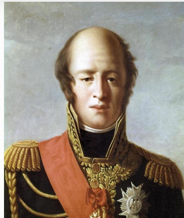
Луи Никола Даву