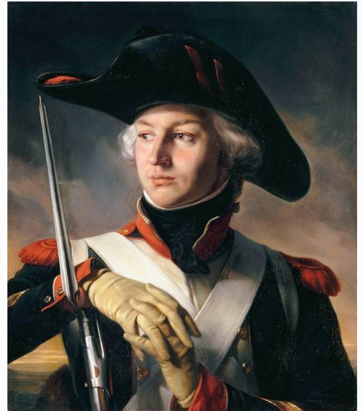
Жан Андош Жюно