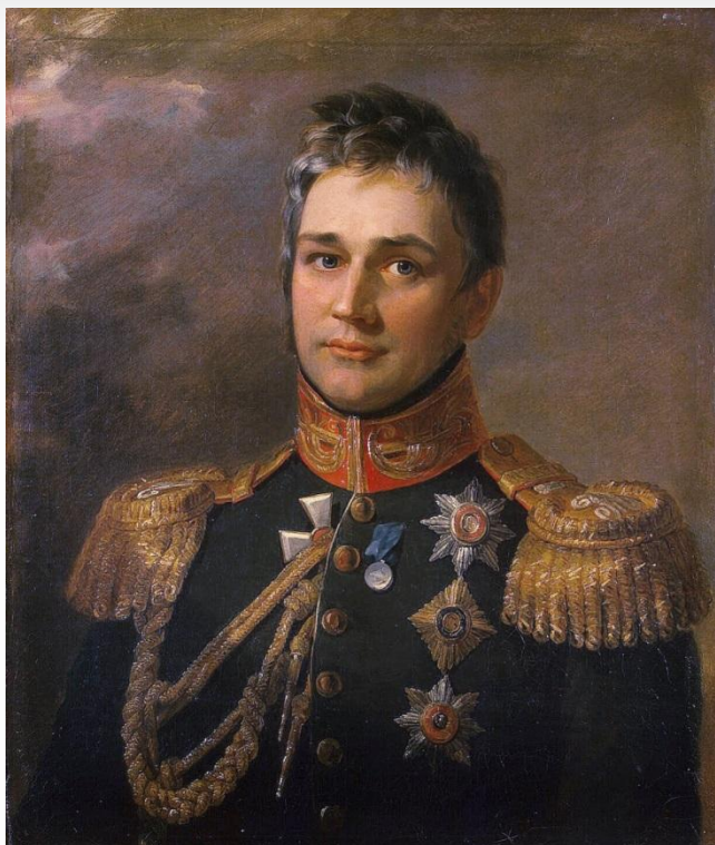
Михаил Семёнович Воронцов