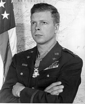
Ричард Айра Бонг

Американский лётчик-истребитель, участник Второй мировой войны. Во время Тихоокеанской кампании, летая на истребителе P-38 Lightning, совершил 200 вылетов, сбил 40 японских самолётов и повредил 11, став самым результативным боевым пилотом в истории США. Был удостоен высшей военной награды США - Медали Почёта. Погиб при испытаниях реактивного истребителя F-80 Shooting Star.