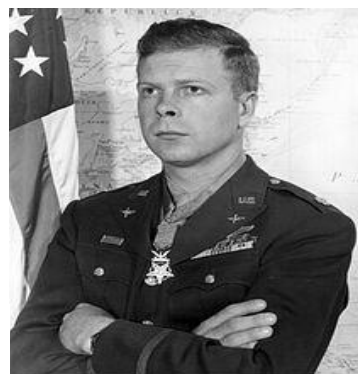
Ричард Айра Бонг