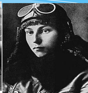
Александр Иванович Покрышкин