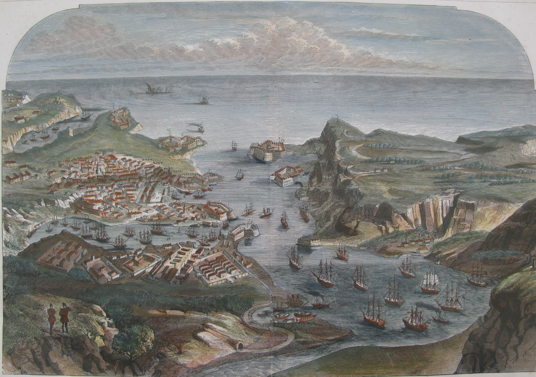
1. Ruin af Cherson. 2. St. Wladimirs Kirke. 3. Karantänshamnen. 4. Lazarettet. 5. Karantänstørtet af 51 K. 6. Alexanderstørtet af 64 K. 7. Batteri af Sewastopol af 50 K. 8. Fort Nicolaus, 192 K. i 3 våningar. 9. Fort Paul, 90 K. 10. Kasern for Dock-arbetarne. 11. Drydocks for Krigsfartygens reparatur. 12. Hospitalet. 13. Ammunitionsførråd. 14. Sødra hamnen for mindre ørlogsfartyg og fræmmende koffardifartyg. 15. Staden Sewastopol. 16. Artilleri-viken. 17. Arsenalen. 18. Kaserner. 19. Sewastopols fæstningsmurar. 20. Viaduct. 21. Tunnell. 22. Hamnplads. 23. Indre hamnen med ryske fløttan. 24. Inkermans fyrbåk. 25. Kronohageri. 26. Batterier. 27. Signalskøg. 28. Fort Constantin, 104 Kanoner. 29. Fort Katarina, 120 K. i 3 våningar. 30. Batteri. 31. Engelske ångfregatten Fury og 2 ryske Skonerter. 32. Svarte Floden.