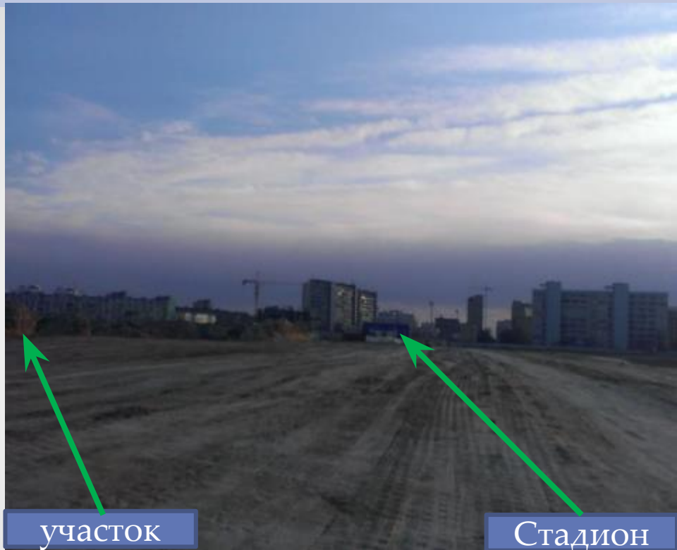
фото места строительства