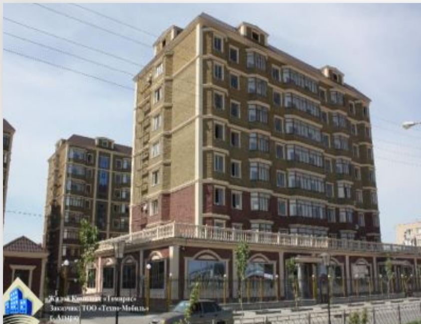
Жилой комплекс «Томирис»