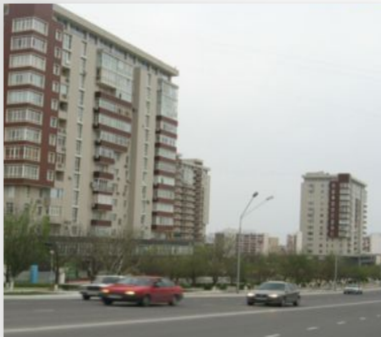
ЖК «Ботанический сад» в 10 мкр.