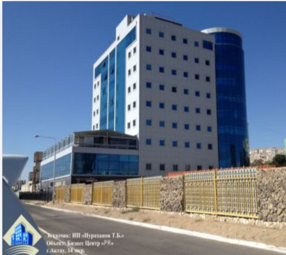
Бизнес комплекс «PR», 14 мкр.