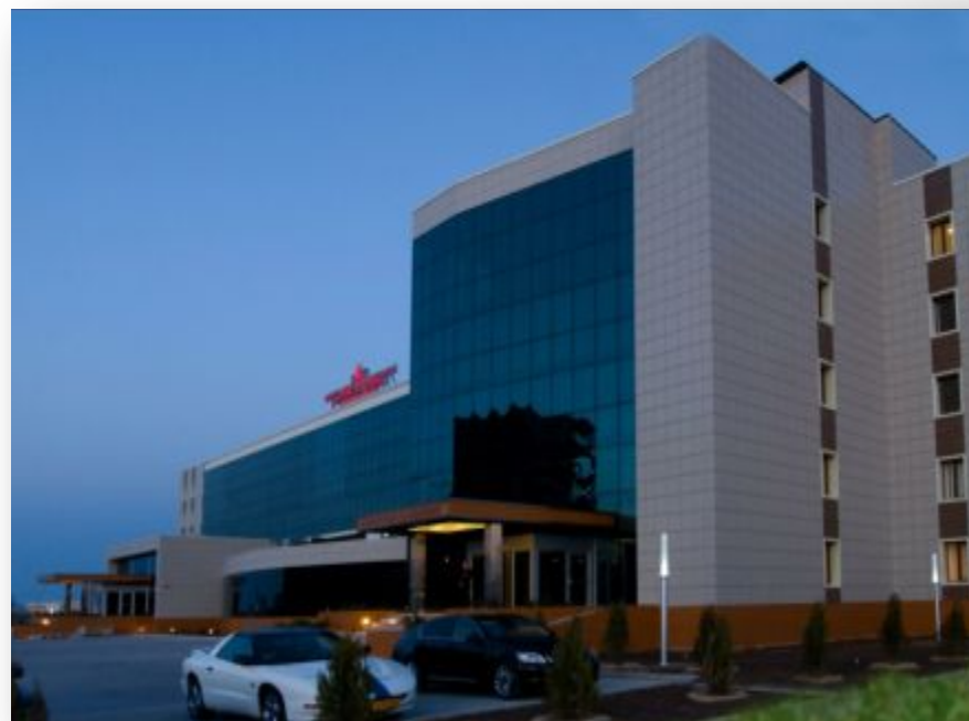
Гостиничный комплекс «Grand Hotel Nur Plaza», 29 мкр.