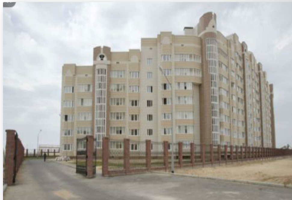
9-ти этажный, 100 квартирный жилой дом в 15 мкр.