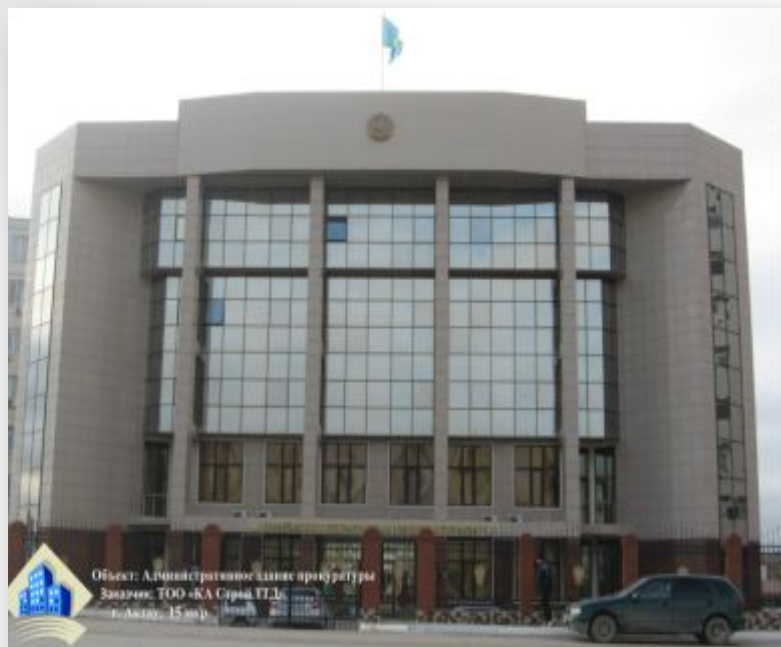
Административное здание областной прокуратуры в 15 мкр.