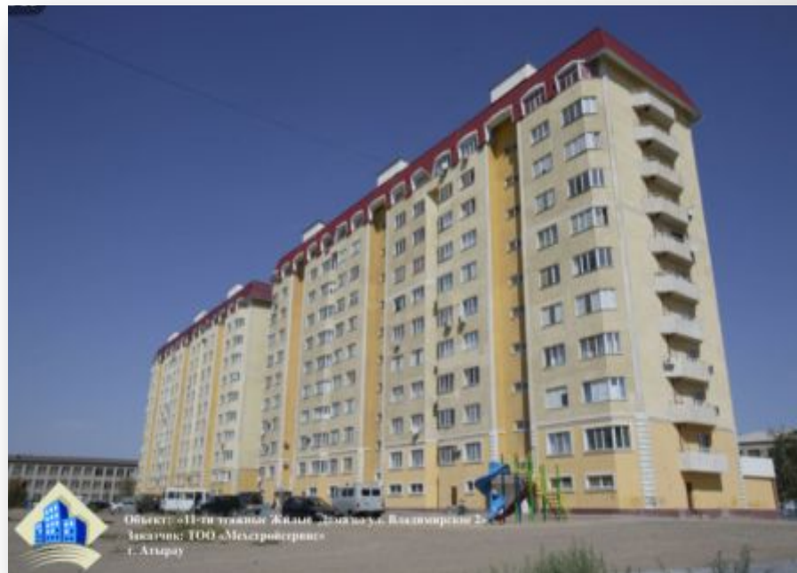
11-ти этажные жилые дома