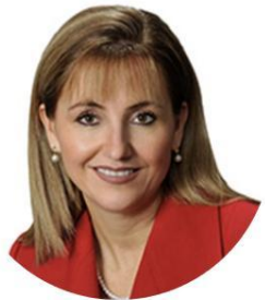
Gloria Guevara Manzo

PRESIDENT & CEO WORLD TRAVEL & TOURISM COUNCIL