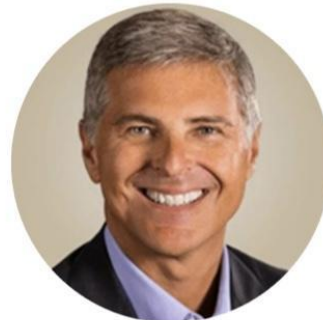
Christopher J Nassetta